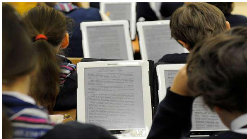
2- сурет Электронды оқулық арқылы оқыту

етеді. Компьютер оқу құралы ретінде потенциалдық мүмкіндіктерді іске асыруға жағдай жасайды, мысалы, графикалық образдың бейформалылығы немесе оны жүзеге асырудың стереотиптік жағдайы. Электрондық оқулық- мемлекеттік білім беру стандартына сәйкес әзірленген оқу курсының жүйелі мазмұнынан және оның бөлімдерінен тұратын, мемлекеттік органдар бекіткен мәртебесіне ие қарапайым оқулықтың анықтамалық тапсырмалардың, жаттығулар мен зертханалық практикумдардың қасиеттерін қамтитын электрондық оқу басылымы [2-сурет]