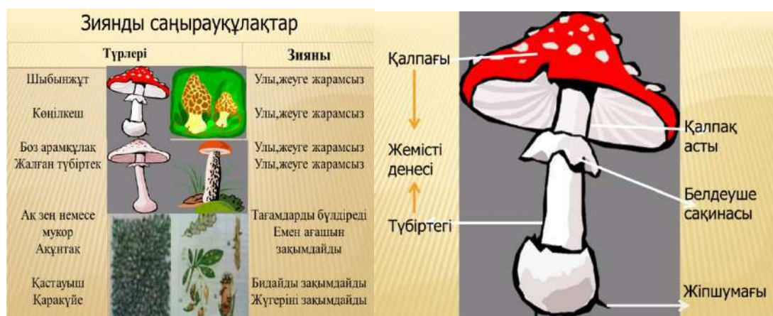
1-сурет. Интерактивті тақтаның көмегімен саңырауқұлақ тақырыбына түсіндірме

1. Викидің көмегімен орындалатын бірлескен жобалар. Бұл техникалық құрал орта мектеп командаларында және тақырыптық модульдер бойынша оқыту жобалары, оқу аралық жобалар үшін өте қолайлы. Вики бірлескен жобаларының артықшылықтарының бірі олардың желіде жасалатындығы болып табылады. Сондай-ақ бағалаумен қатар, рөлдерді бөлу және қызметті нақты анықтап алу осы стратегияны іске асыратын бірлескен оқытушы жобалардың табысты болуы үшін өте маңызды болып табылады.